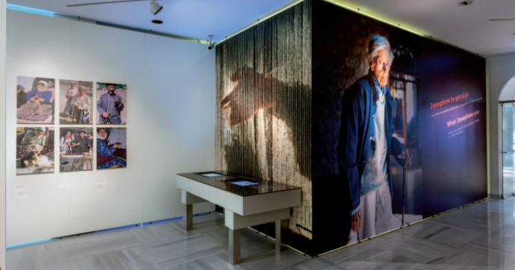
G40 Wandelemente, Museum, Istanbul G40 wall panels, museum, Istanbul