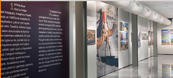
Leichtbauwandssystem G40 im Ausstellungsraum Lightweight construction wall system G40 in Show Room