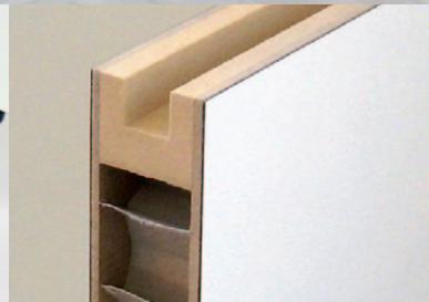
Papierwabenmittellage Honeycomb Design