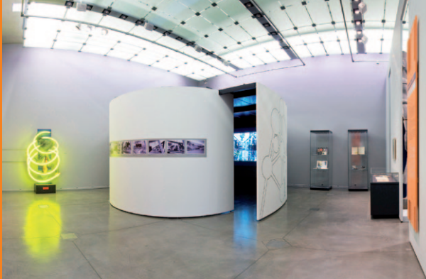
G40 Wandelemente und Rundwände für Museum, Luxemburg G40 wall panels and curved wall for museums, Luxemburg